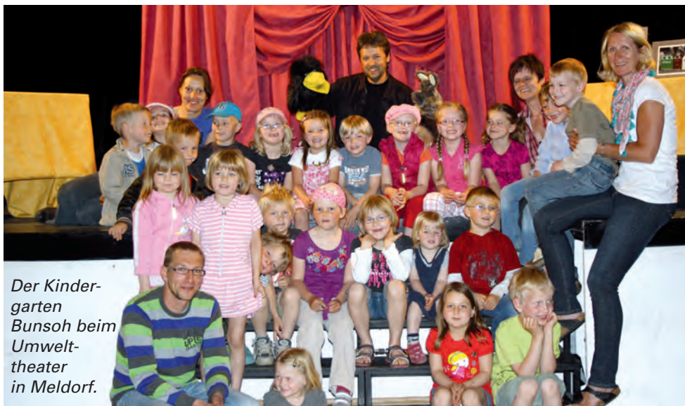
Der Kindergarten Bunsöh beim Umwelttheater in Meldorf.

Bildung fängt bei den Kleinsten an. Daher unterstützt die AWD auch die Kindergärten und lädt sie bereits zum zehnten Mal zum Umwelttheater ein. Damit wird das bei den Kleinen besonders stark ausgeprägte Umweltbewusstsein gefördert.