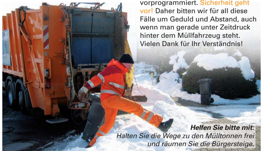
Helfen Sie bitte mit: Halten Sie die Wege zu den Mülltonnen frei und räumen Sie die Bürgersteige.

Wir alle haben die letzten beiden Winter noch in Erinnerung und wissen, welche Behinderungen es durch Schnee und Glatteis geben kann. Insbesondere auf Nebenstraßen sind dann Verspätungen und Ausfälle vorprogrammiert. Sicherheit geht vor! Daher bitten wir für all diese Fälle um Geduld und Abstand, auch wenn man gerade unter Zeitdruck hinter dem Müllfahrzeug steht. Vielen Dank für Ihr Verständnis!