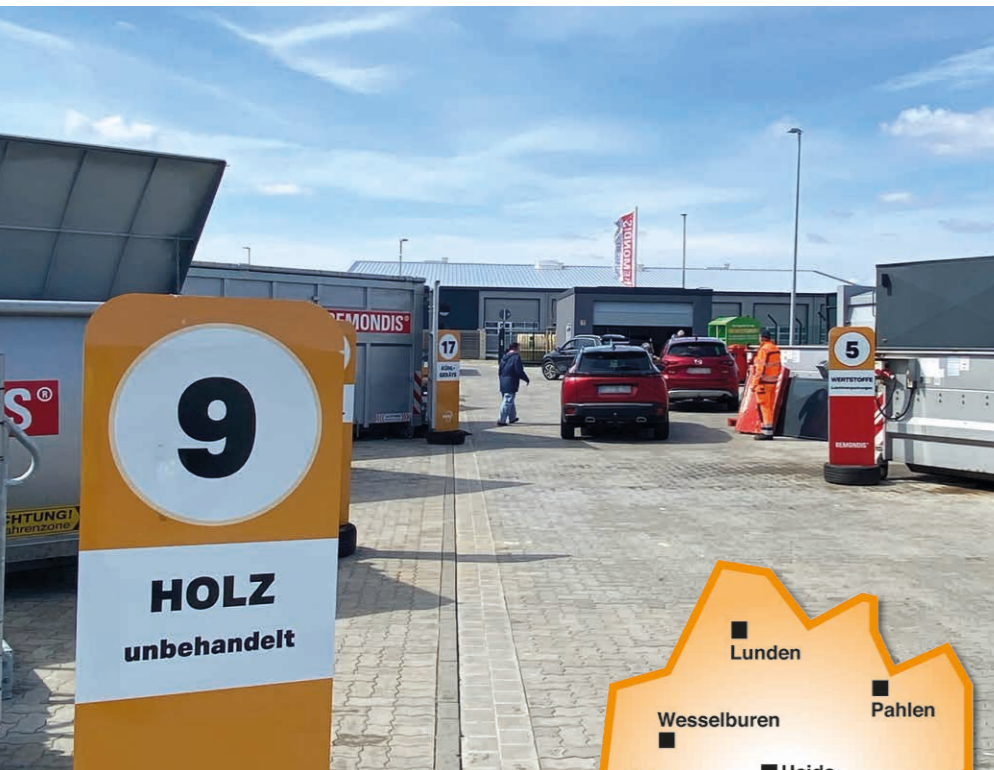
Neun Recyclinghöfe: kurze Wege in Dithmarschen.