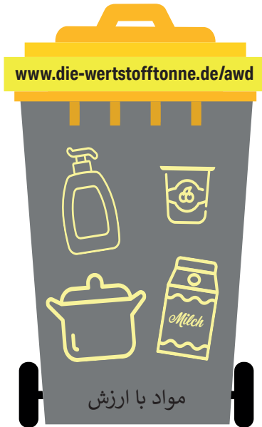
مواد با ارزش

پاسخ داده می‌شوند "Abfallwirtschaft Dithmarschen GmbH" سوالات توسط : (0481) 85500 ☎ · service@awd-online.de · www.awd-online.de